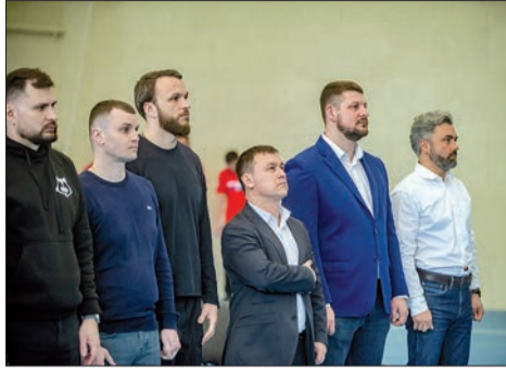
В День воссоединения Севастополя и Крыма с Россией впервые прошла матчевая встреча по боксу между сборными коман-